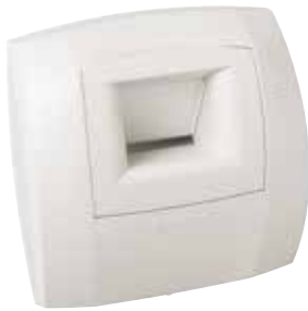
Bahia Curve sanitari

Bocchetta di estrazione igroregolabile per una portata in estrazione che si adatta al tasso di umidità dei locali viziati come bagni e cucina.