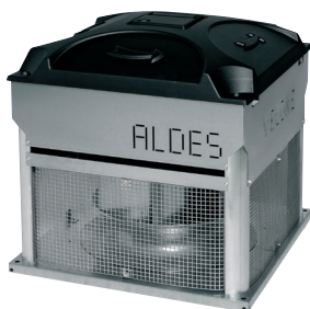
VELONE senza opzioni

VELONE F400 - 8.5 - Tri è una torretta di evacuazione fumi classificata F400-120 per locali del terziario, industriali e condomini.