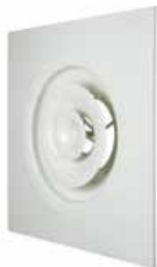
A842 TP D315 AXB 600X600 RAL9010-30%

A 842 TP è un diffusore di immissione circolare regolabile tramite vite che diffonde l'aria negli edifici del terziario.