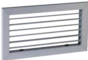
Griglia AC 101

Bocchetta di estrazione rettangolare in alluminio anodizzato. Singolo filare di alette mobili regolabili singolarmente.