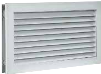
Griglia AC 181