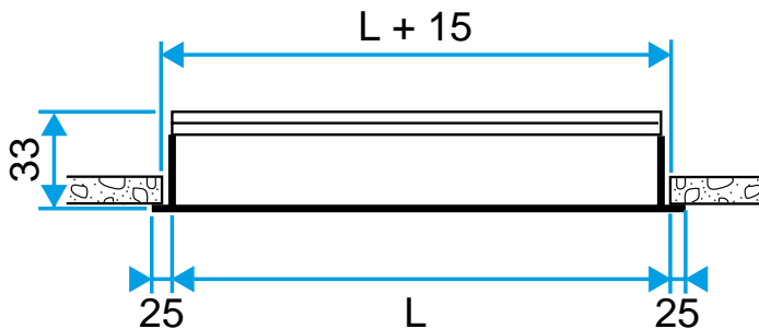
Diffuseur ALD 610 - 620