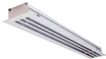
Diffuseur ALD 610 - 620