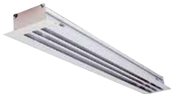
Diffuseur ALD 610 - 620