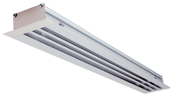
Diffuseur ALD 610 - 620