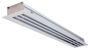
Diffuseur ALD 610 - 620

Il ALD 610-620 è un diffusore lineare in alluminio a fessure fisse per la diffusione o l'aspirazione dell'aria negli edifici terziari.