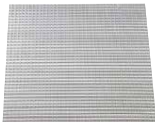
Griglia AO 123