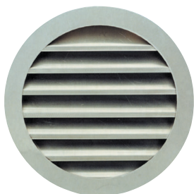
Griglia AR 637

> La griglia esterna circolare a muro AR637 permette l'ingresso dell'aria esterna e la fuoriuscita di quella viziata degli impianti di ventilazione