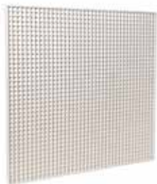
Griglia AU 124

La griglia per soffitto in alluminio AU 124 permette l'estrazione di aria da un locale per gli impianti di ventilazione o condizionamento dell'aria.