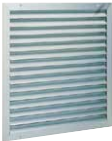
Griglia AWA 251