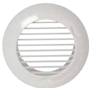
Griglia BIP D 80 e D 125 mm