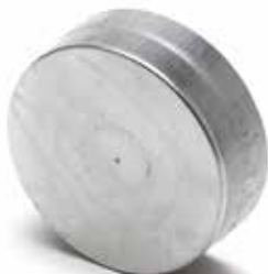
Coperchio Maschio Femmina