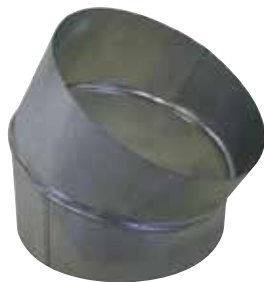
Gomito a 30°