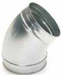
Gomito a 45° imbutito