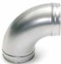
Gomito a 90° imbutito