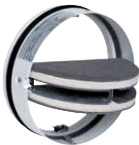
Cartuccia tagliafuoco CF1/CF2