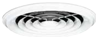
Diffuseur SC 831

SC 831 è un diffusore circolare concentrico in acciaio che diffonde aria fissa in immissione orizzontale.