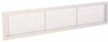
Grille Gridlined wall