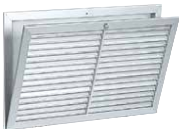
Griglia AC 161

La griglia murale apribile in alluminio con filtro AC 161 permette l'estrazione di aria per gli impianti di ventilazione o condizionamento dell'aria.