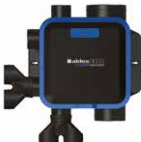
Gruppo EasyHOME Hygro COMPACT Premium HP+ visto