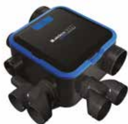
Gruppo EasyHOME Hygro COMPACT Premium HP+

Gruppo EasyHOME HYGRO COMPACT Premium HP+