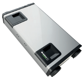
InspirAIR® Side 150 Classic Modbus Destra

Unità di ventilazione con recupero di calore per installazione a soffitto o a parete verticale. Tre taglie da 150, 240 e 370 mc/h.