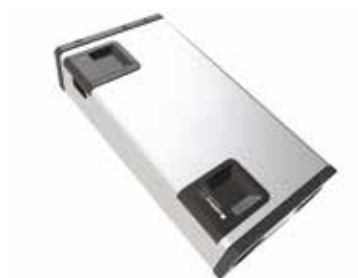
InspirAIR® Home SC Classic