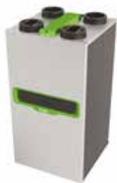
InspirAIR® Top 300 Classic

InspirAIR® TOP è la soluzione di ventilazione a doppio flusso con recupero di calore ad altissima efficienza che migliora la qualità dell'aria indoor.