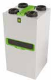
InspirAIR® Top 300 Premium

InspirAIR® TOP è la soluzione di ventilazione a doppio flusso con recupero di calore ad altissima efficienza che migliora la qualità dell'aria indoor.