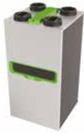
InspirAIR® Top 450 Classic

InspirAIR® TOP è la soluzione di ventilazione a doppio flusso con recupero di calore ad altissima efficienza che migliora la qualità dell'aria indoor.