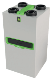
InspirAIR® Top 450 Premium

Unità di ventilazione con recupero di calore per installazione a parete o a pavimento con attacchi verticali. Due taglie da 300 e 450 mc/h.