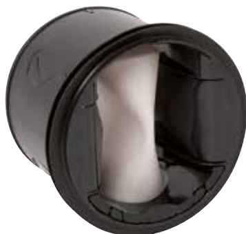
MR MONO STANDARD

> MR MONO è un regolatore di portata in grado di garantire una portata costante in un campo di pressione variabile per gestire IAQ, comfort e risparmio energetico