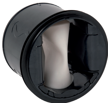
MR MONO HP

> MR Mono Alta Pressione è un regolatore di portata in grado di garantire una portata costante a pressioni elevate, per gestire IAQ, comfort e risparmio energetico