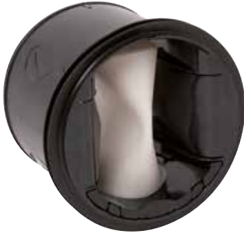
MR MONO STANDARD

> MR MONO è un regolatore di portata in grado di garantire una portata costante in un campo di pressione variabile per gestire IAQ, comfort e risparmio energetico