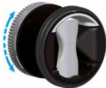
MR MONO STANDARD

> MR MONO è un regolatore di portata in grado di garantire una portata costante in un campo di pressione variabile per gestire IAQ, comfort e risparmio energetico