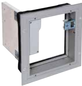
OPTONE «Classico» 1V