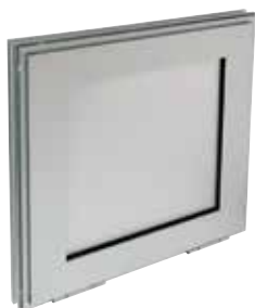
OXYTONE Pannello 2012 chiusa, in posizione attesa