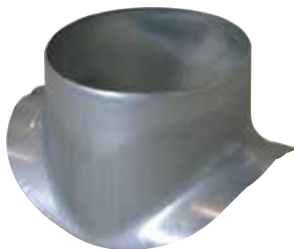
Attacco a Squadra Circolare 90°