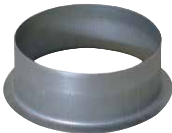
Attacco a Squadra Piatto 90°