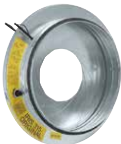
Registro a Iride