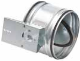
RGEM à joint motorisable