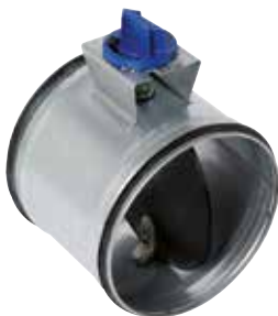
RGE à joint manuel et motorisable