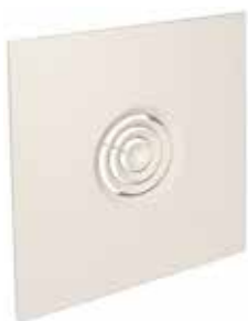
Diffusore SC 832TP