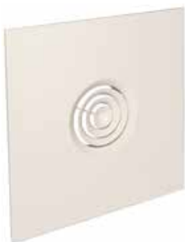
SC 832 TP FO D200 (AxB=600x600)

SC 832 TP è un diffusore concentrico in acciaio che diffonde aria fissa in immissione orizzontale, pensato per sostituire un pannello di soffitto standard.