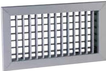
Griglia SC 102D