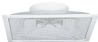
Diffuseur SC 319R