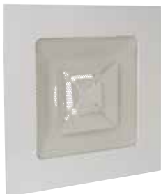
Diffusore SC 369R

SC 369 R è un diffusore quadrato in lamiera traforata per estrazione dell'aria.