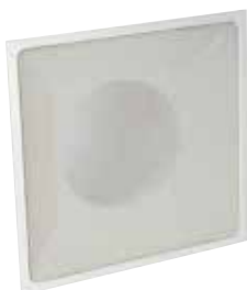
Griglia di ripresa SC 370