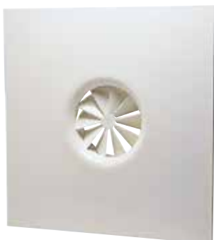
SF 861T FO D200 AxB=600x600 (c20)

SF 861 T è un diffusore fisso a soffitto a getto elicoidale che diffonde l'aria nei locali del terziario.