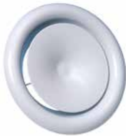
Bocchetta SR 145