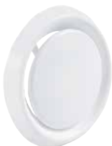
Bocchetta SR 149