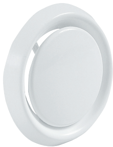
Bocchetta SR 149