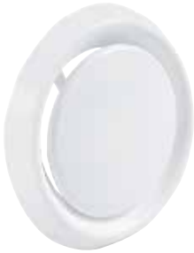
Bocchetta SR 149